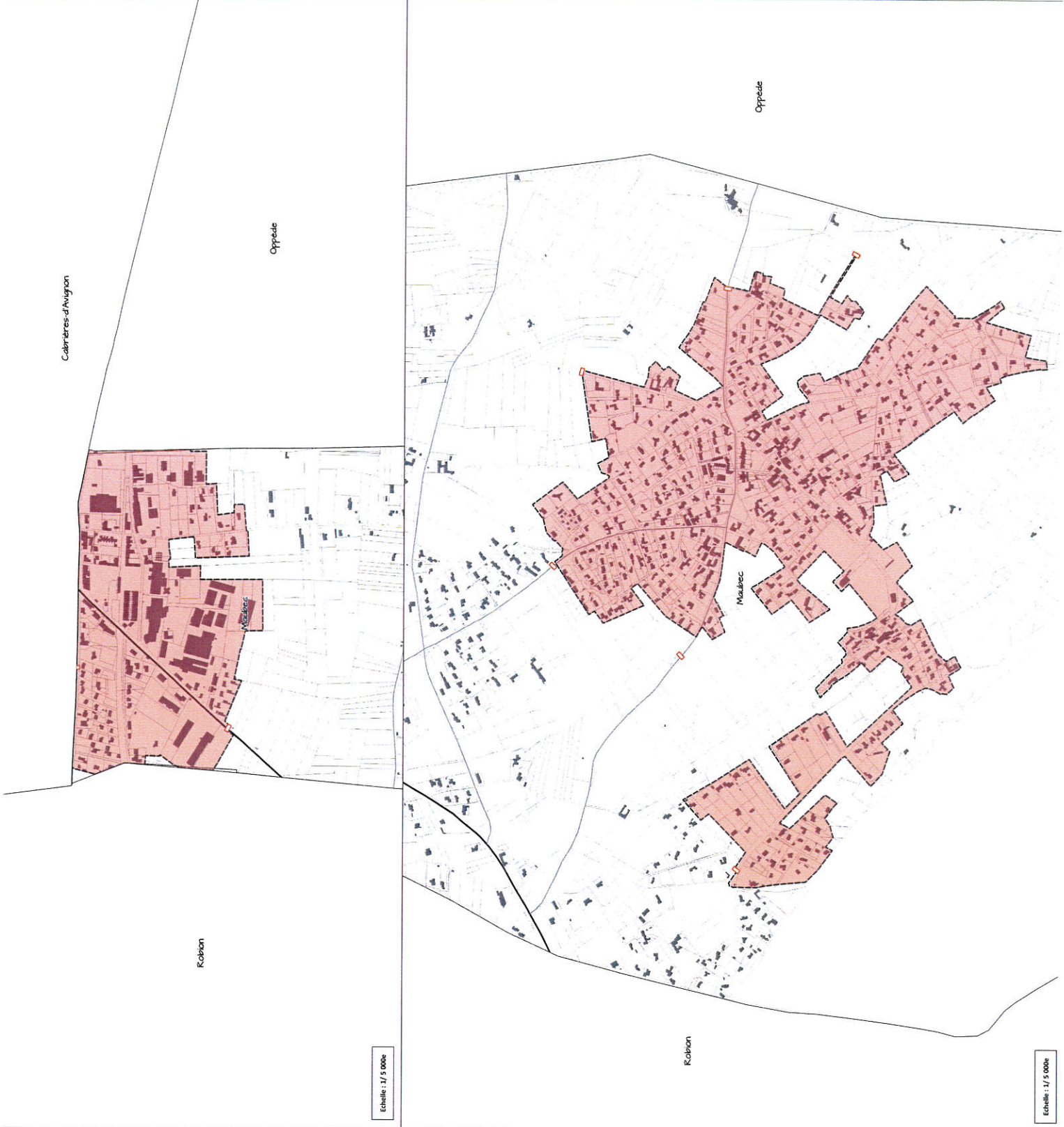
Echelle : 1/5 000e