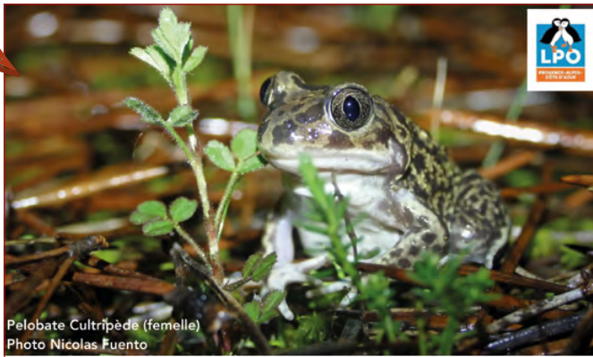
Pelobate Cultripède (femelle)